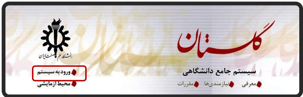
(شکل شماره ۱)

جهت ورود به سامانه جامع دانشگاهی گلستان، لازم است پس از باز کردن مرورگر (اینترنت اکسپلورر ویا گوگل کروم) به آدرس اینترنتی golesan.iust.ac.ir مراجعه گردد تا "صفحه ورود به سیستم" گلستان به شکل زیرنمایش داده شود. (شکل شماره ۱)