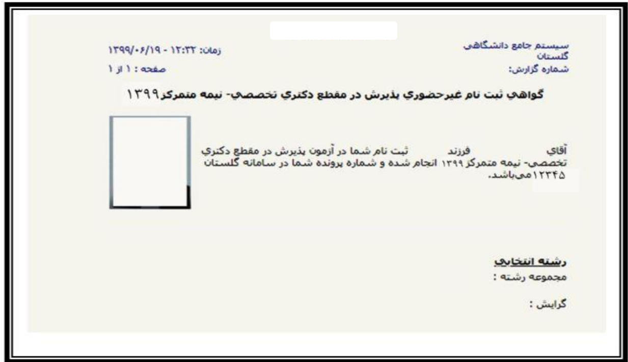
(شکل شماره ۱۲)