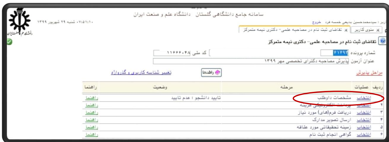
(شکل شماره ۴)

در صفحه "تقاضای ثبت نام در مصاحبه علمی-دکتری نیمه متمرکز" ردیف اول وارد "مشخصات داوطلب" شده و نسبت و به تکمیل اطلاعات خود اقدام فرمائید. (شکل شماره ۴)