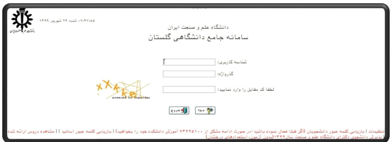
(شکل شماره ۲)

جهت ورود به سامانه آموزشی گلستان در قسمت شناسه کاربری "شماره داوطلبی+۰۵۸۰۰۰" (برای نمونه کسی که شماره داوطلبی آن "۱۲۳۴۵۶" است بصورت ۰۵۸۰۰۱۲۳۴۵۶ وارد نماید) و در قسمت کلمه عبور از کدملی (در صورت وجود عدد صفر در اول کد ملی از وارد نمودن آن خودداری نمائید) استفاده نمائید. (شکل شماره ۲)